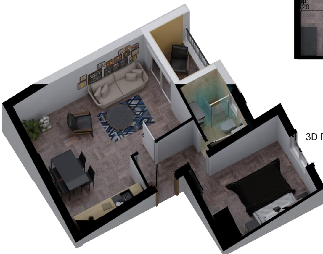
3D PRIKAZ STANA