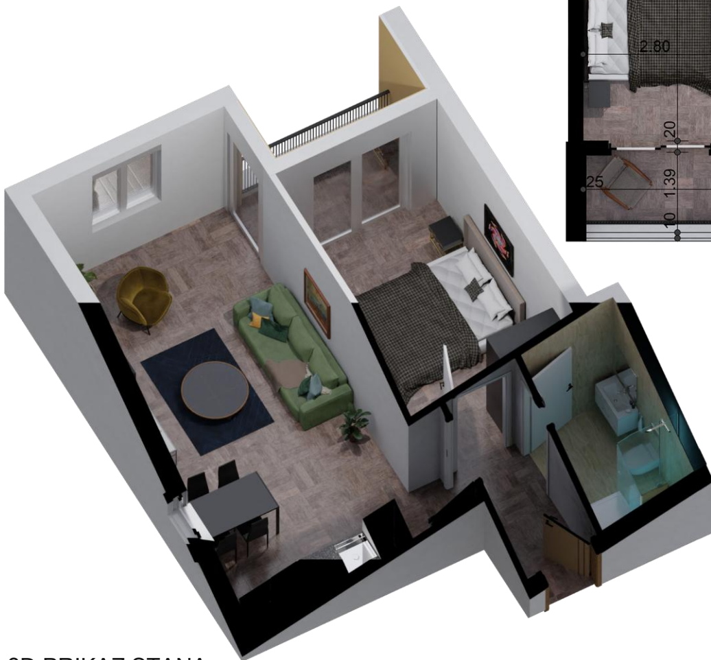
3D PRIKAZ STANA